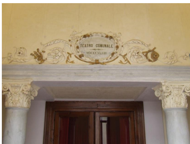
02 - Ingresso del Teatro. In origine vi era stato posizionato il simbolo della Trinacria.