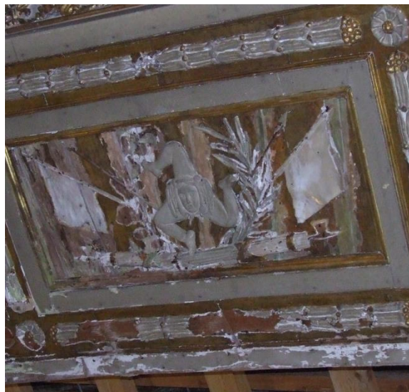
01 - Simbolo della Trinacria.